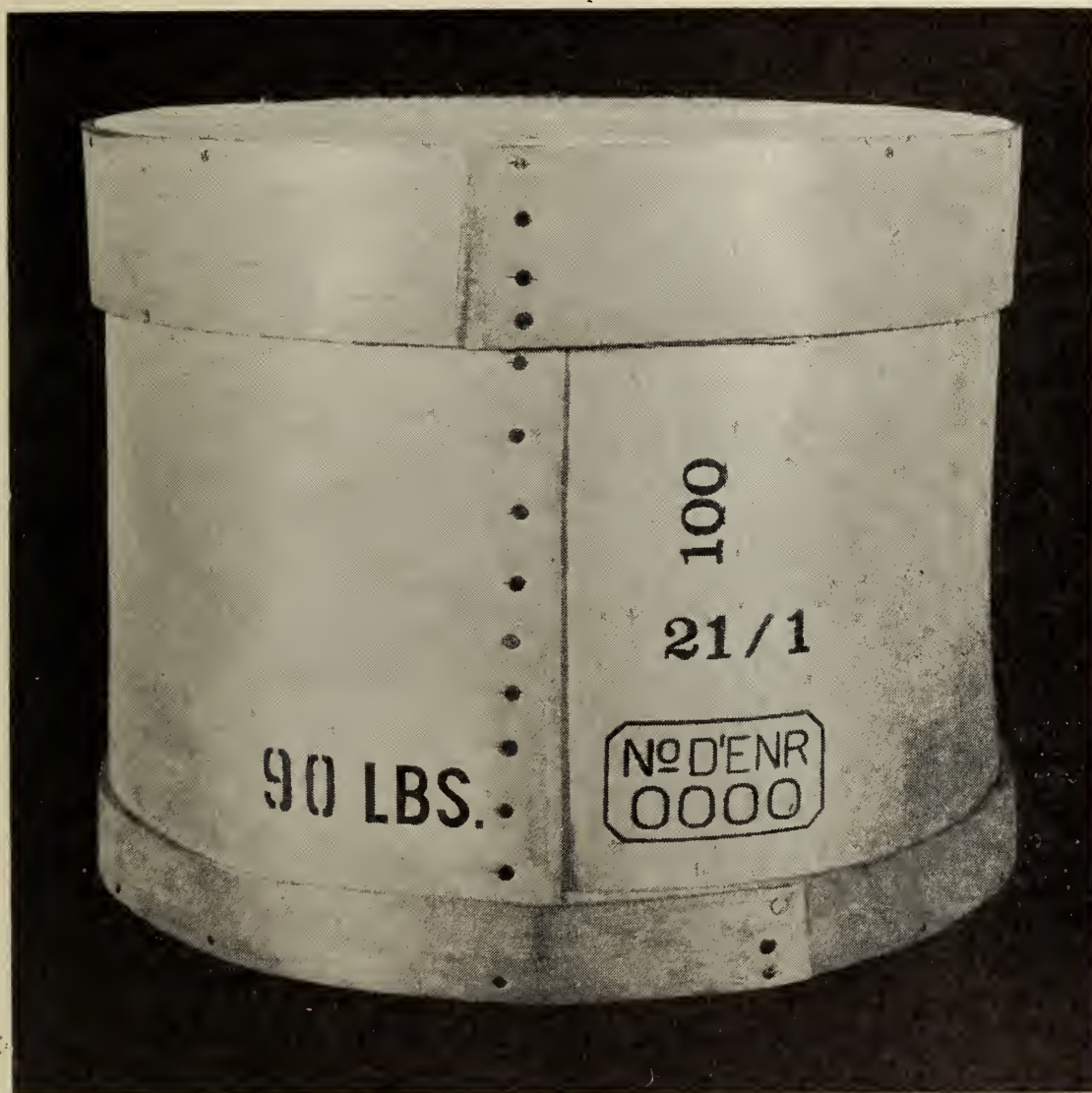
Boîte de fromage

En marquant la date de fabrication sur les meules et sur les boîtes, se rappeler que le chiffre supérieur, si les chiffres sont placés l'un par-dessus l'autre, ou le chiffre de gauche, s'ils sont sur la même ligne, représentent le jour du mois; le chiffre inférieur ou de droite indique le mois de l'année.